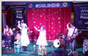
"Rádio Osquindo", espetáculo recheado de cantigas de roda, jogos e brincadeiras, parlendas e ritmos brasileiro

Dia 5 Maio 2018 (sábado) 19h30: Espetáculo "Ovos, Suor