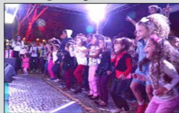
Em Mirai, o encantamento das crianças com o espetáculo do Grupo Esquindo