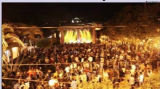
Festival de Viola de Piacatuba e Gastronomia vai atrair grande público ao distrito leopoldinense