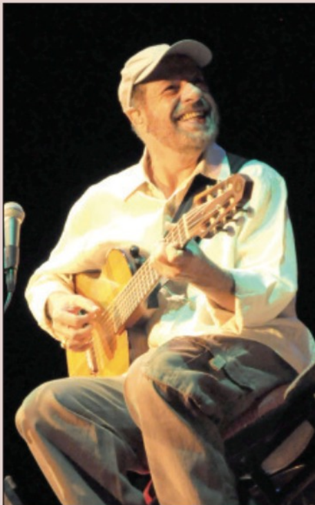
O cantor e compositor João Bosco abriu as comemorações dos 30 anos da Fundação Simão

Após o show, João Bosco elogiou a Programação de Eventos da Casa Simão: "Vocês estão de parabéns, fiquei sabendo da programação e das ideias que vocês tem para o futuro. Espero que continuem assim, que tenham vida longa na produção de encontros como esses". Pág 5