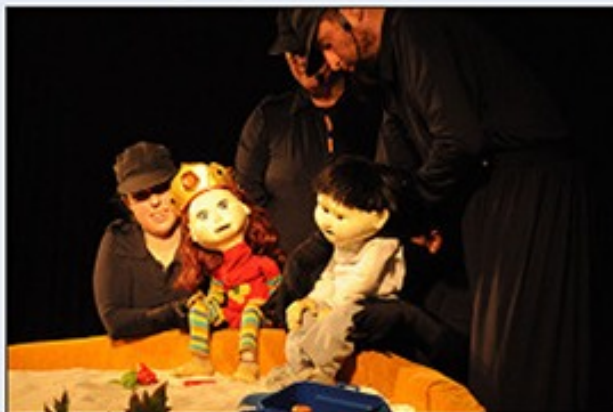
Os bonecos do Grupo Morpheus, de São Paulo