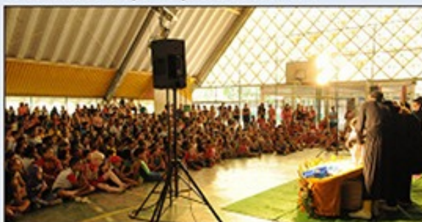
Público presente no encontro com os bonecos do grupo Morpheus

A Fundação Simão José Silva/ Casa de Cultura Simão - em parceria com a Secretaria Municipal de Educação - trouxe a Cataguases o espetáculo infantil, "Pés Descalços", com o Grupo Morpheus Teatro, de São Paulo.