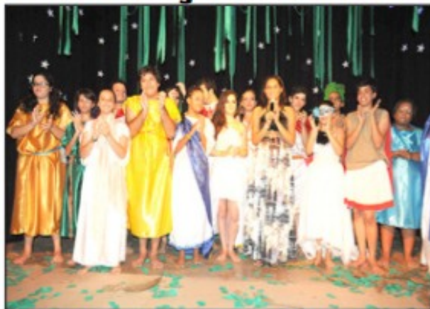
O grupo que apresentou "Sonho de uma Noite de Verão"